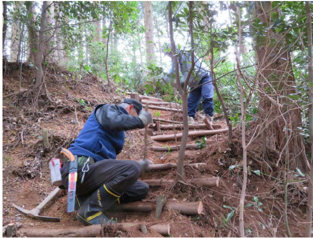
大変な重労働です

高城砦は、野田城主の菅沼定盈 さだみつ が築いたとされていますが、確かなことは分かりません。