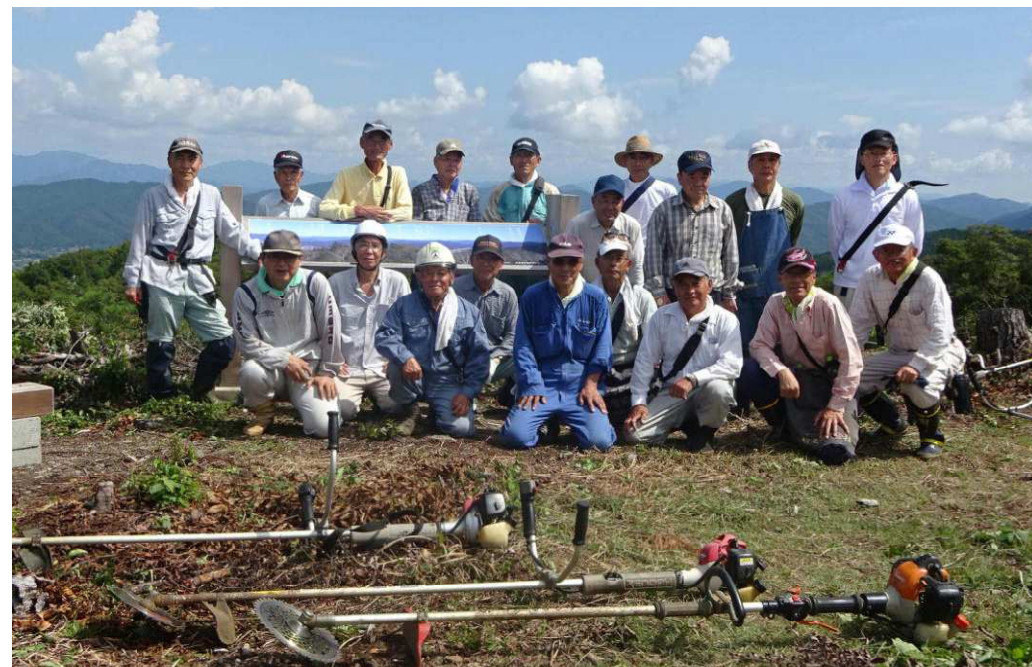
草刈りを終えて 19名が参加