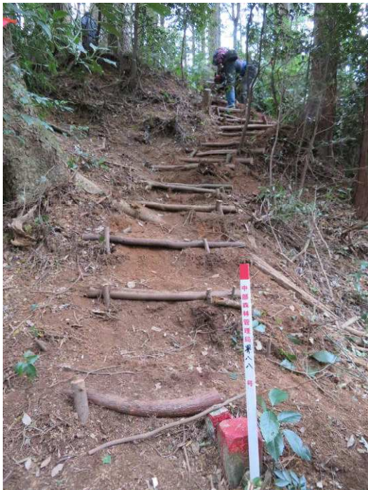
堀切へ降りる危険箇所が安全に