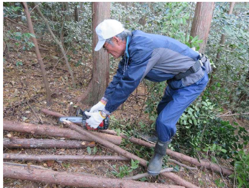
高城砦への散策路に設置する木杭作り