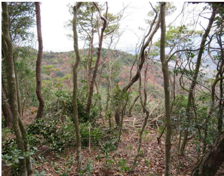
間引きにより少し視界良好に

この日は地域行事と重なり、若干参加者が少なく十二名の参加となりましたが、出丸と高城砦の二つの班に分かれて行いました。 出丸は間引き程度の間伐、高城砦は散策路の整備、遺構の整備、急斜面への階段設置作業です。