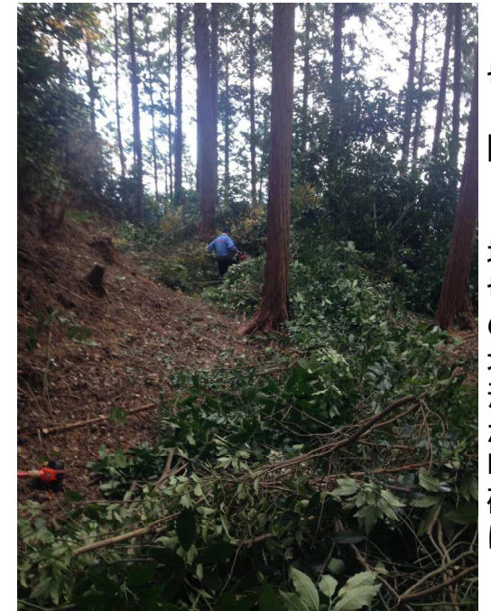
切り開くと堀切の地形が明確に