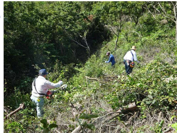
本丸南側斜面の草刈り