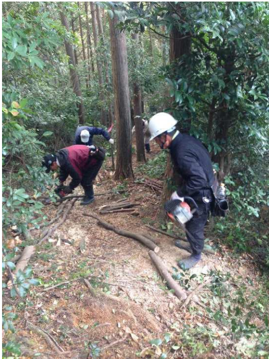
高城砦への急斜面に木杭で階段を設置

高城砦は、野田城主の菅沼定盈 さだみつ が築いたとされていますが、確かなことは分かりません。