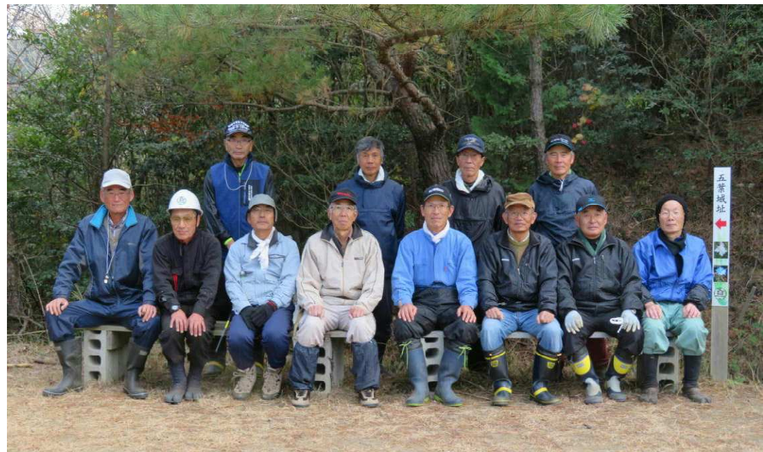
富岡の人のパワーは最高ですね