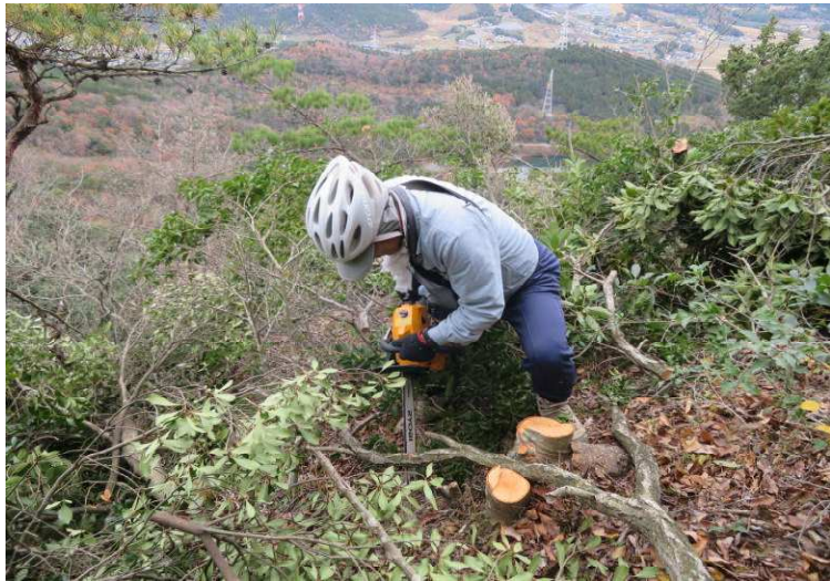
出丸西方面の間伐作業