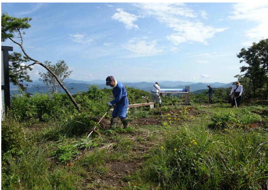
本丸跡の草刈り作業